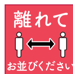
離れて お並びください